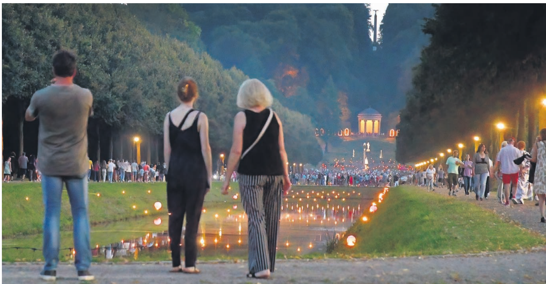
Mit dem 69. Lichterfest in den historischen Parkanlagen endete jetzt die Konzertsaison im Klever Forstgarten. Wie in jedem Jahr kamen viele Besucher, um sich von dem Lichterspektakel verzaubern zu lassen, Musik zu hören und das Feuerwerk zu sehen.