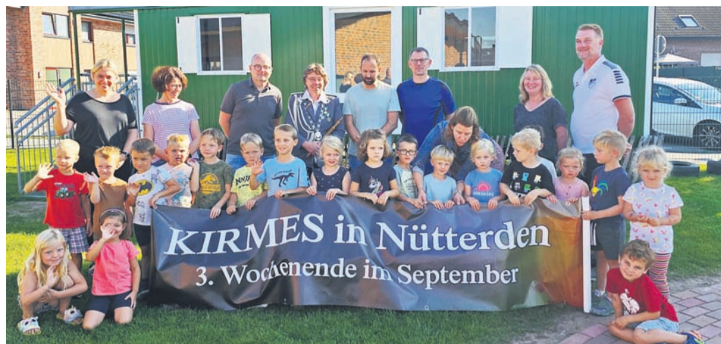
Alle freuen sich auf die Kirmes in Nütterden. Auch in diesem Jahr wird es 1.000 Freifahrtscheine für die Kinder der Grundschule und der drei Kindergärten geben.