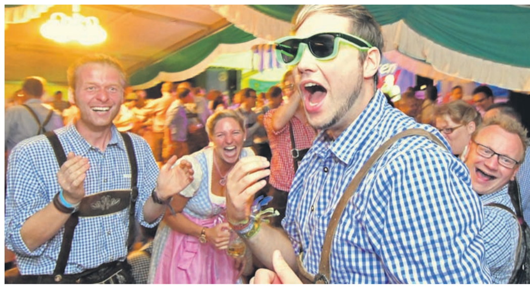
Ausgelassene Wiesenstimmung herrscht wieder beim Oktoberfest Kevelaer am Samstag, 7. Oktober, im Festzelt auf dem Parkplatz Sportzentrum Kevelaer-Hüls. Für die passende Stimmung sorgt die Band Alpen-Editio.