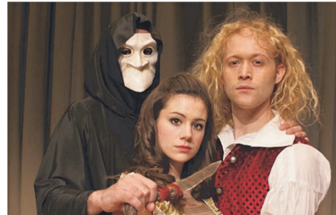
Zum 25. Mal gastiert die American Drama Group Europe am 20. September in Geldern.

Die Aufführung findet open air im Innenhof von Schloss Haag statt; Zufahrt nur über die Kapellener Straße. Warme, wetterfeste Kleidung, feste Schuhe, Decke und Sitzkissen sind angeraten. Bei extrem schlechten Witterungsbedingungen wird die Veranstaltung kurzfristig in die Aula im Lise-Meitner-Gymnasium, Geldern, Friedrich-Nettesheim-Weg 6-8, verlegt. Karten gibt es im Vorverkauf für 19 Euro, ermäßigt 14 Euro plus Gebühr bei Bücher Keuck und im Bücherkoffer Derrix in Geldern. An der Abendkasse zahlt man 24 Euro, ermäßigt 18 Euro.