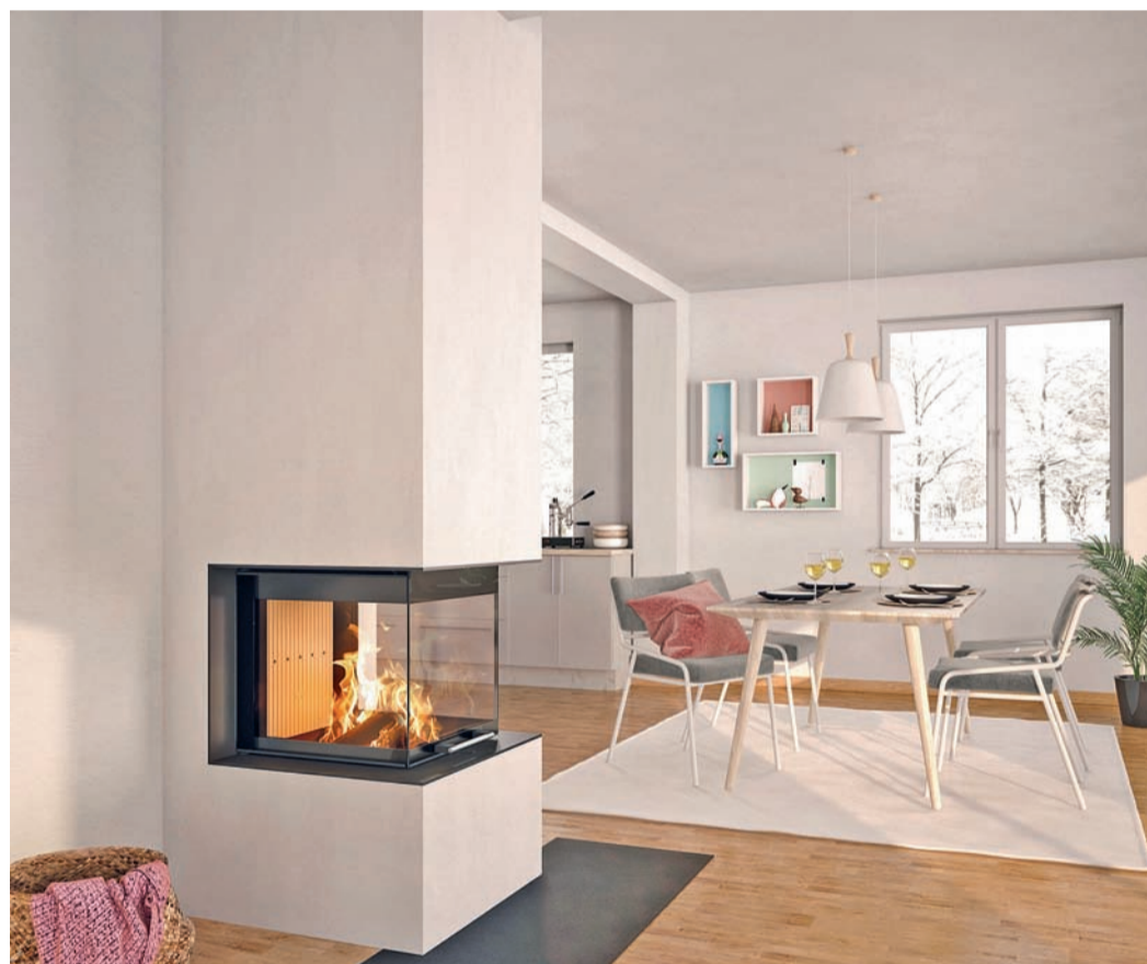
Immer ein besonderes Erlebnis – leuchtende Flammen von drei Seiten.