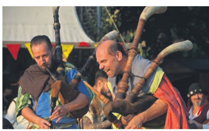
Die Spielleute sorgen für Unterhaltung.

ASPERDEN. Einmal mehr können die Besucher beim Mittelalterfest am Kloster Graefenthal, Maasstraße 48-50, in die Welt der Ritter, Edelleute und Gaukler eintauchen. Die Tore öffnen sich am kommenden Samstag, 16., und Sonntag, 17. September.