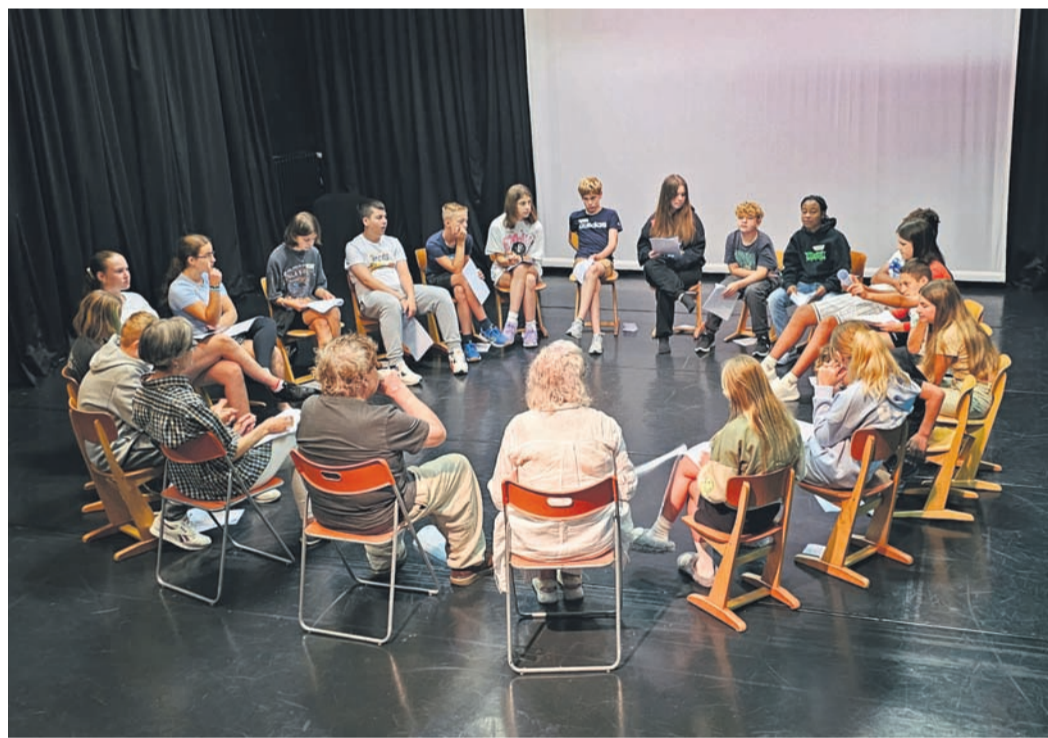
Am Tag vor der Aufführung: Die Klasse 7 der Euregio Realschule aus Kranenburg beim Theater mini-artin Bedburg Hau – eine letzte Besprechung.

Eltern-Kind-Yoga: Vom 22. September bis 24. November findet freitags von 15.30 bis 17 Uhr ein kostenloser Workshop für Kinder von vier bis sechs Jahren mit einer erwachsenen Begleitperson im Familienzentrum Lebensquelle, Schulstraße 29 in Nütterden, statt. Anmeldungen per E-Mail an lebensquelle@lebenshilfe-kleve.de oder 02826/ 5923.