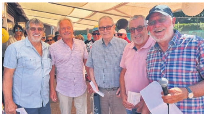
Mitgliederehrungen standen ebenfalls auf dem Programm der Jubiläumsfeier.