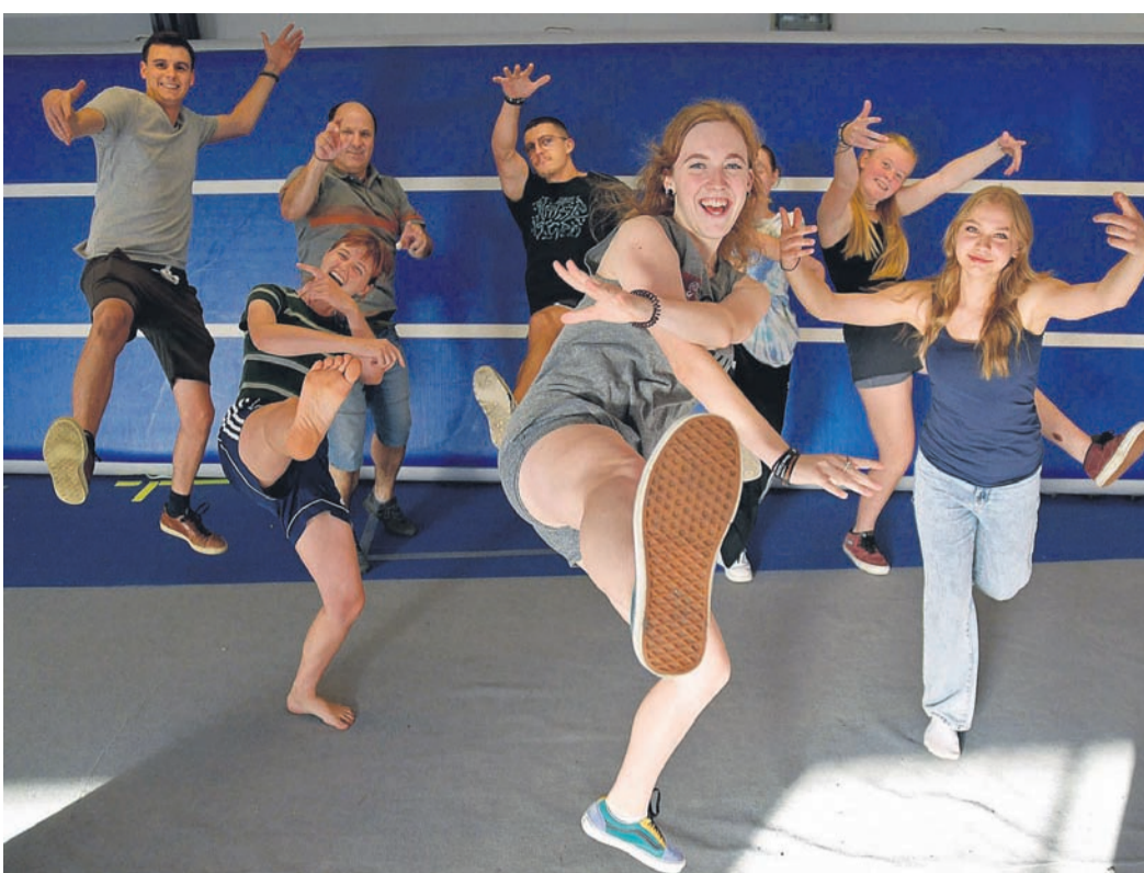
Die Teilnehmer der Move Factory freuen sich bereits auf die Premiere ihrer neuen Show „Take Off!“

KLEVE. Die Sommerpause ist vorbei und die Lila Pause Disco geht in die nächste Runde: Am kommenden Freitag, 15. September, wird im Radhaus am Sommerdeich 37 von 17 bis 20 Uhr Oktoberfest gefeiert. Auch ohne Fassanstich und „O zapft is“ sorgt das Team für das richtige Ambiente und schmückt in blau-weiß. Dirndl oder Lederhose sind gern gesehen. Noch ein Tipp des Lila Pause Teams: Der Verein Electric Visions Cleve möchte gerne eine neue Veranstaltungsreihe für Menschen mit und ohne Beeinträchtigung in Kleve etablieren. Die Veranstaltungen finden im Café der EVC Kulturfabrik Kleve (Ackerstraße 50-56) statt und heißen „Du bist Perfekt so wie du bist“. Am 29. September (17 bis 21 Uhr) startet die nächste Veranstaltung (Vol. 4), bei der es Livemusik und einen DJ geben wird, der die Lieblingslieder der Gäste spielt. Der Eintritt ist frei!