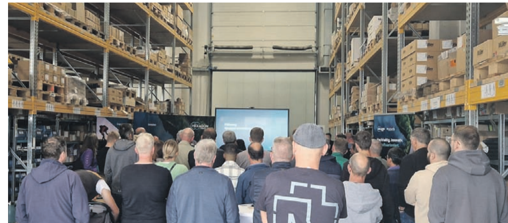
Der Bewerbertag bei Wystrach stieß auf große Resonanz. Mehr als 100 Teilnehmende hatten sich auf dem Werksgelände eingefunden.

Bewerbertag der Firma Wystrach mit Rekordbeteiligung