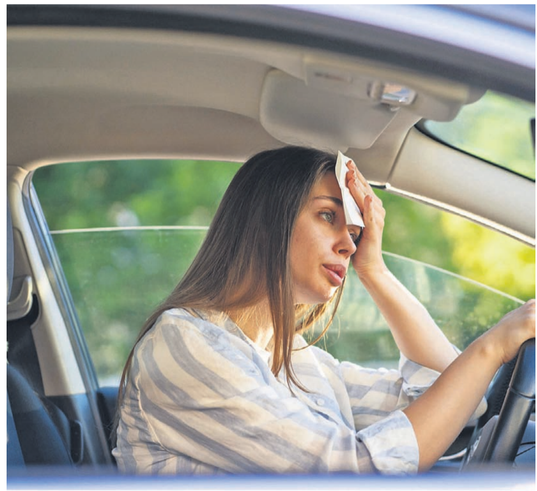
An heißen Tagen kann die Standheizung vor dem Abfahren Frischluft ins Auto befördern.