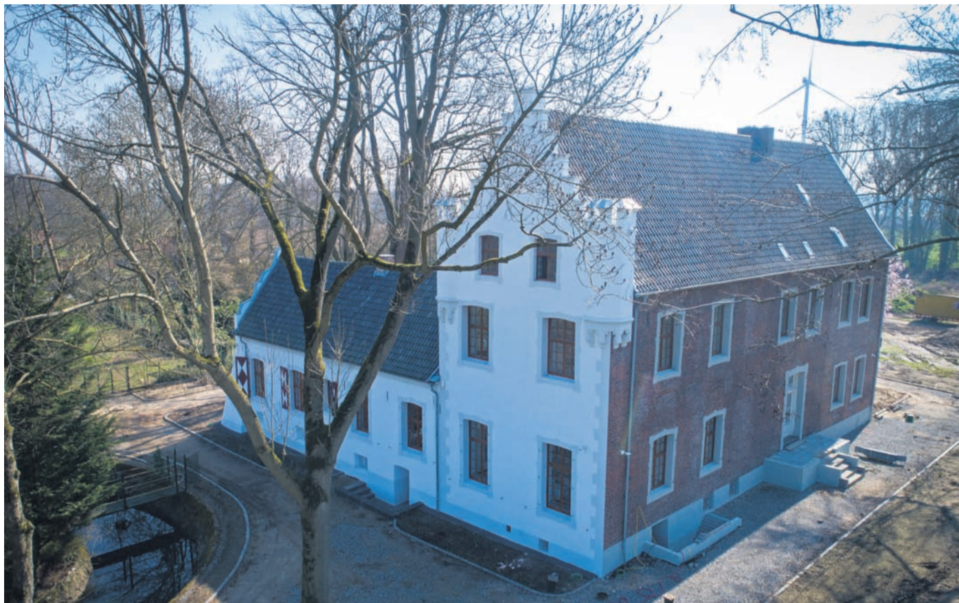
Zum Tag des offenen Denkmals am morgigen Sonntag, 10. September, öffnen tausende Denkmäler Tür und Tor und lassen interessierte Besucher hinter ihre Kulissen blicken. So auch das Haus Ingenray in Pont. Mehr dazu auf Seite 3

Der Kreis Kleve beginnt voraussichtlich am Montag, 11. September, mit Bauarbeiten an Fahrbahn und Radweg der Klever Straße (K17) in Veert. Zwischen den Einmündungen Kölner Straße (B9) und dem Kreisverkehr Martinstraße erhalten Fahrbahn und Radweg eine neue Deckschicht. Für die Dauer der Arbeiten wird die Klever Straße in diesem Bereich voll gesperrt. Die Umleitung ist ausgeschildert und erfolgt über die Kölner Straße (B9) und der Venloer Straße (B58). Die Bauzeit beträgt etwa zwei Wochen. Der Kreis Kleve investiert für gesamte Maßnahme rund 120.000 Euro. Ansprechpartner ist die Kreis Kleve Bauverwaltungs-GmbH (KKB), Telefon 02821/977090. Auswirkungen hat die Baumaßnahme auch auf den Busverkehr. Betroffen sind die Stadtlinien 1 und 3 sowie die Linie 73. Die Busse werden die Umleitung über die B9 und B58 fahren müssen. Die Haltestellen an der Klever Straße (Schulstraße und Am Booshof) können für die Zeit der Umleitung nicht angefahren werden. Aufgrund der längeren Fahrtstrecke und des erhöhten Verkehrsaufkommens kann es sowohl morgens als auch mittags zu Verspätungen kommen.