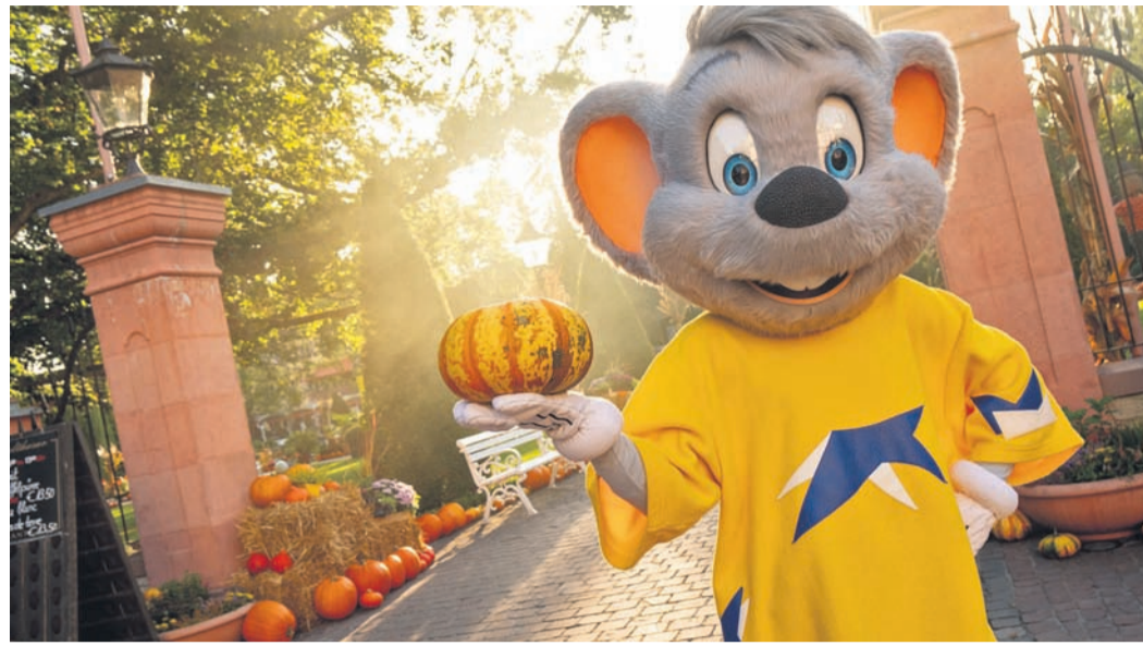
Im Europa-Park in Rust dreht sich im Herbst alles um Spannung, Horror und Halloween.