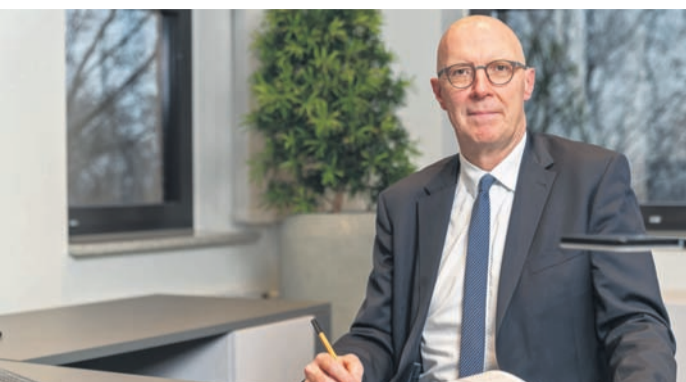
Landrat Gerwers möchte erst prüfen, welche Vorteile und welche Nachteile mit der Ausweisung des Reichswalds als Nationalpark verbunden sind.

Kreis Kleve überrascht von Aussage von Minister Krischer