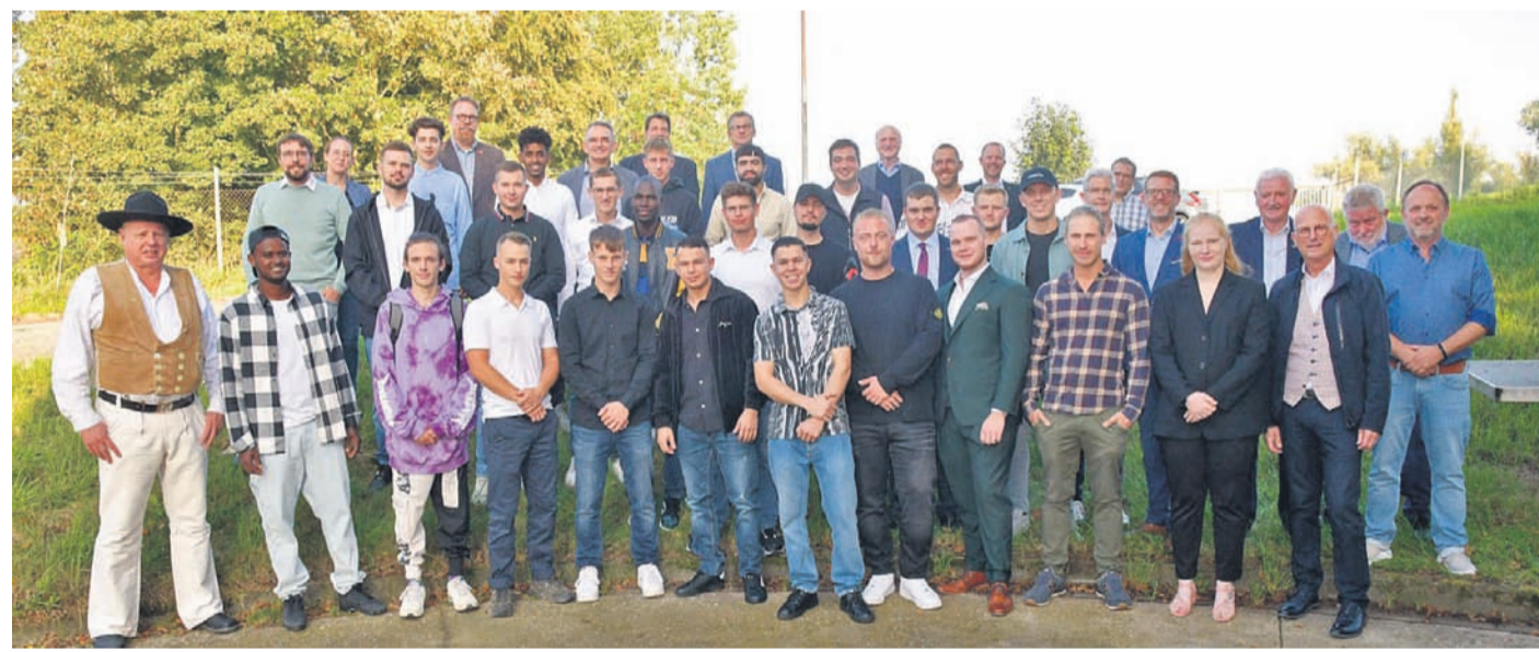
Die Lossprechungsfeier der Baugewerbe-Innung des Kreises Kleve fand auf dem Gelände der ehemaligen Kaserne in Dornick statt.

Im Kreis Kleve haben 40 Azubis ihre Ausbildung im Baugewerbe erfolgreich abgeschlossen