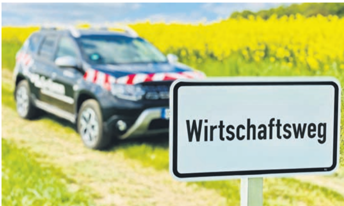
Kevelaer soll ein zukunftsfähiges und bedarfsgerechtes Wirtschaftswegenetz erhalten. Die Planungen werden in einer Bürgerversammlung vorgestellt.

Weiter sollen Handlungsoptionen für Investitionsentscheidungen und für die dauerhafte Unterhaltung der Wege aufgezeigt werden. Das Vorhaben wird seitens der Bezirksregierung Düsseldorf mit Mitteln der Europäischen Gemeinschaft, des Bundes und des Landes zu 75% gefördert. In einem ersten Schritt wurde in den vergangenen Monaten ein Konzept-Entwurf als Diskussionsgrundlage erarbeitet. Dazu wurden sämtliche öffentlichen und privaten Wege entsprechend ihrer Bedeutung und Funktion klassifiziert: Welche Wege und Brückenbauwerke sind für die Stadt unverzichtbar und haben eine hohe Priorität? Welche Wege könnten im Standard gesenkt, ökologisch aufge-