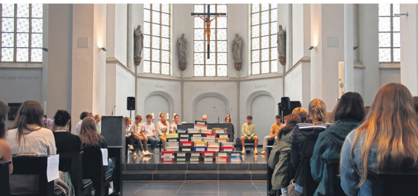
Für den Gottesdienst hatte das Organisationsteam Schuhkartons mit Informationen über den fairen Handel vor dem Altar aufgestellt.

Weitere Informationen gibt es unter www.fairtrade-geldern.de im Internet.