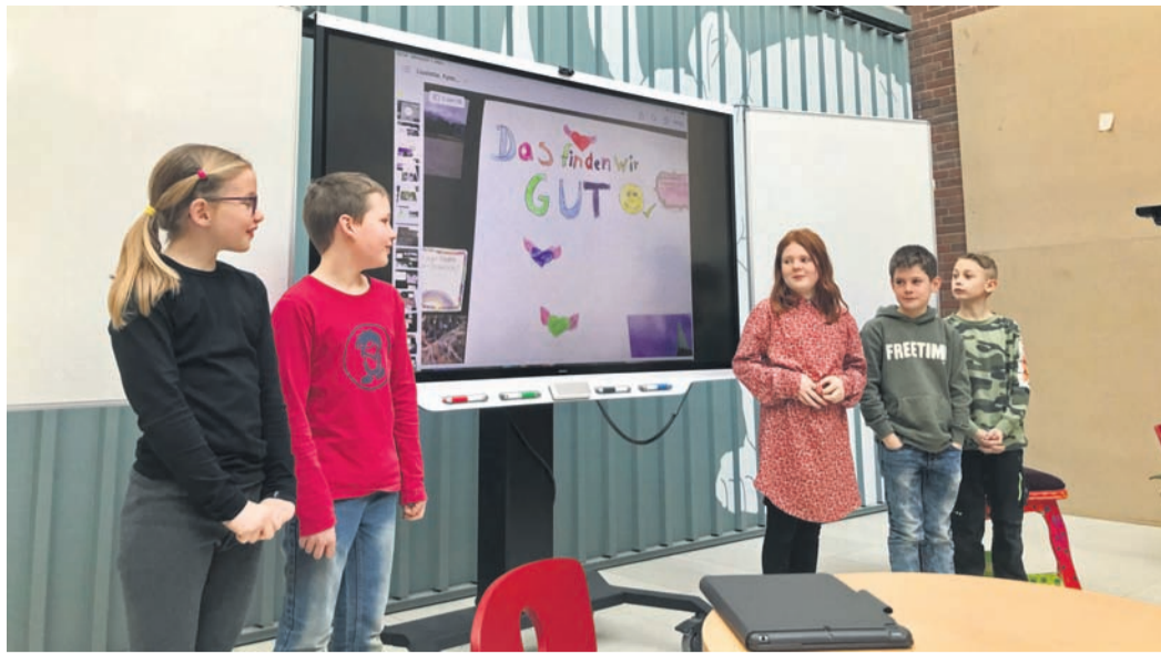
Kinder der Mariengrundschole erläutern, was ihnen an ihrem Umfeld besonders gut gefällt.