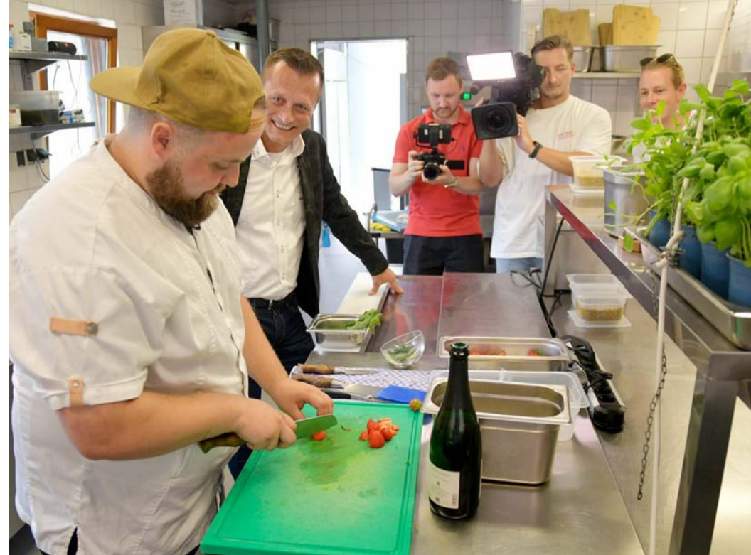
Wenn das Kamerateam mit dem Profi-Koch anrückt, heißt es Ruhe bewahren und zusammenrücken. Auch für die Küchen-Teams waren die Dreharbeiten am Niederrhein eine spannende Erfahrung.