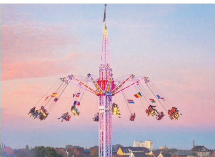
Mit dem Flyover geht es 40 Meter in die Höhe.