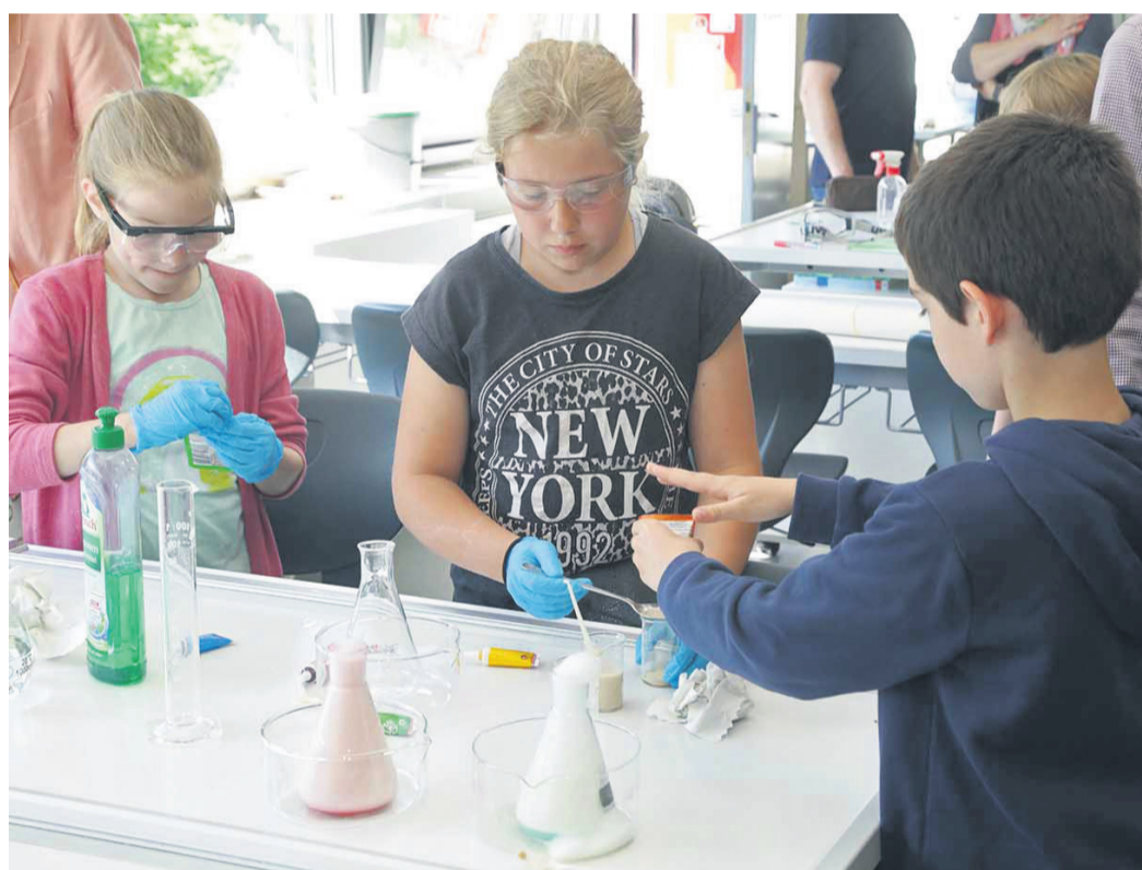
In den verschiedenen Kursen konnten die Kinder, ihren Neigungen entsprechend, Wissen sammeln.

In Chemie gab es zwischen knallende Reaktionen, während die Physiker unter anderem stabile Brücken bauten oder ein Mikrowellen-Gerät untersuchten. Ganz anders als in der Schule zeigte sich der Mathematik-Kurs, indem zum Beispiel mithilfe des Cesar-Codes geheime Botschaften verschlüsselt werden konnten. Neu in diesem Schuljahr war der Mini-Computer Calliope, der von den Informatik-Kinder selbstständig programmiert werden konnte. Auch die Kinder in den sprachlich-künstlerischen Kursen gingen auf große Entdeckungsreise. So reisten die Kinder des Englisch-Kurses in viele englischsprachige