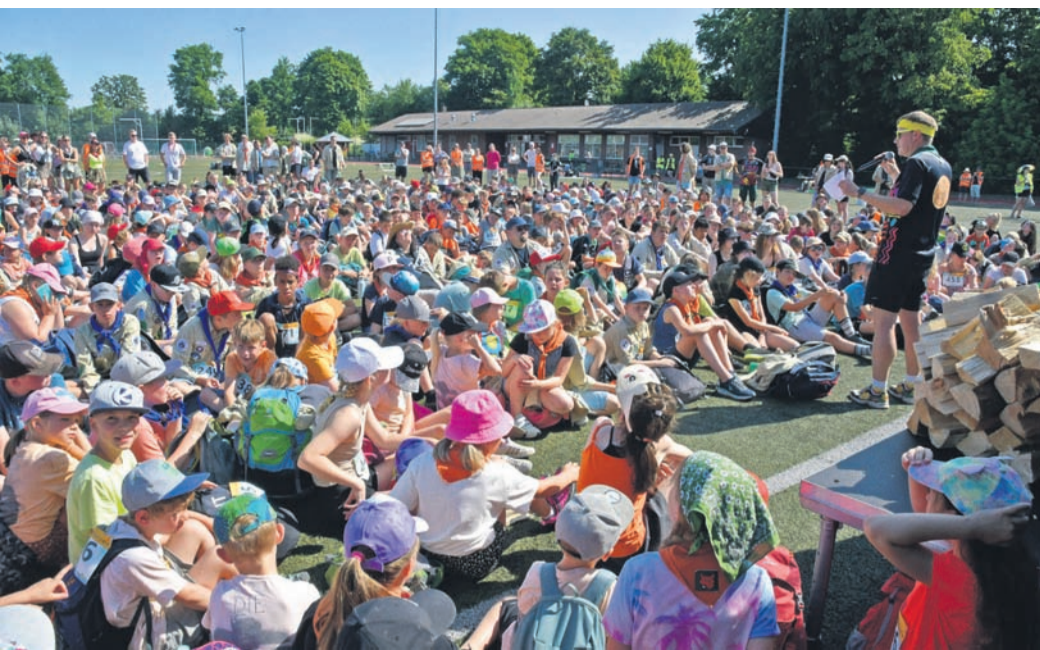
Rund 800 Pfadfinder waren nach Sonsbeck gekommen, um das 50-jährige Bestehen des Bezirks Niederrhein-Nord zu feiern.