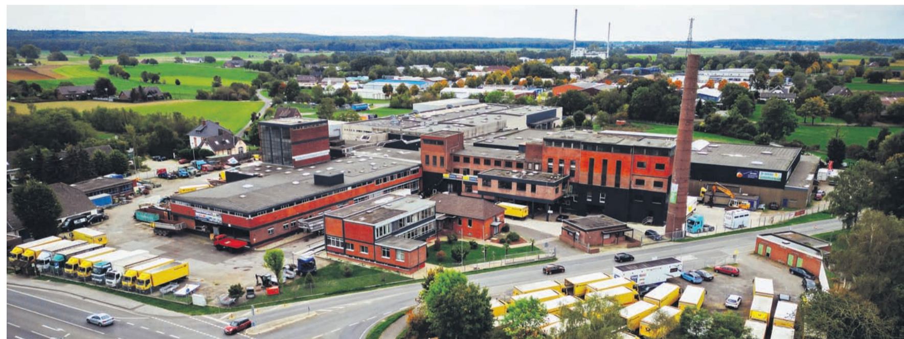
Das Team von Auto Gilles überzeugt deutschlandweit durch Kompetenz und seine Produktvielfalt.