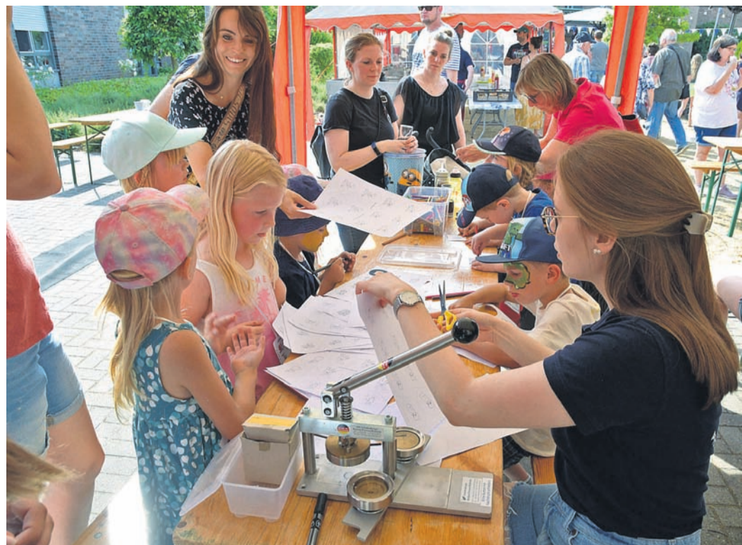
Bei schönstem Wetter hieß es am vergangenen Samstag wieder „Pfalzdorfer Sommernacht“ ausgerichtet von der IPK, auf dem Platz zwischen St. Martinus Kirche und Jugendheim. Es gab jede Menge Spaß für die kleinen Besucher und später Musik vom DJ. So konnte der Abend gemütlich ausklingen.