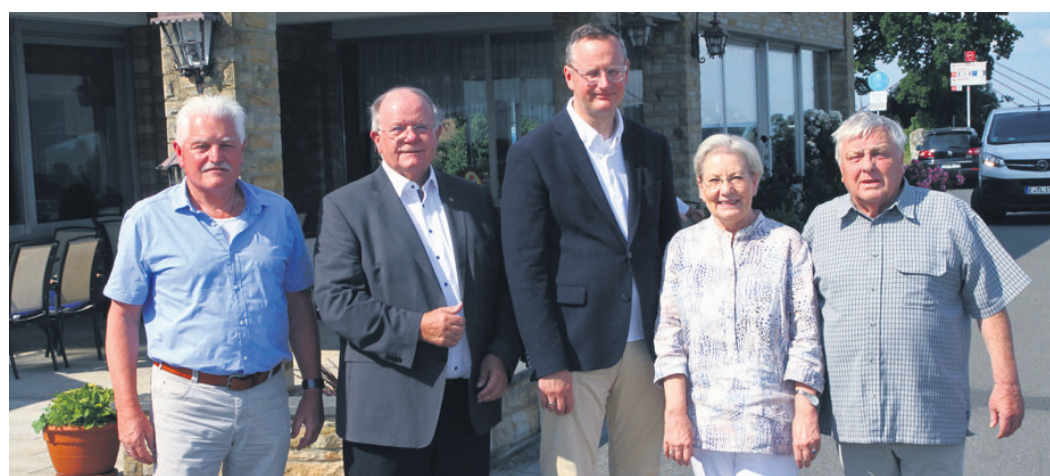
Der neu gewählte Vorstand der Senioren Union Niederrhein.