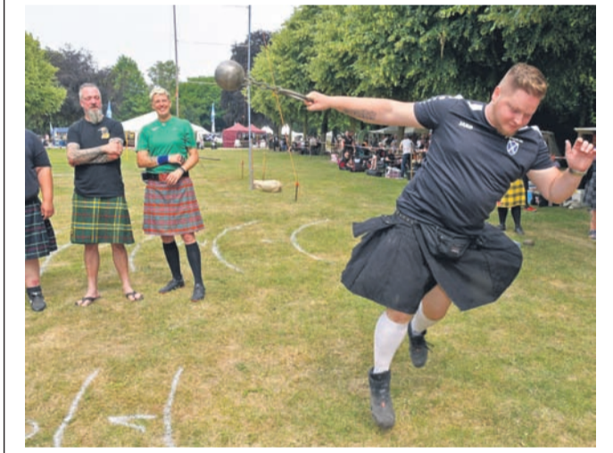
Mehr als nur ein Hauch von Schottland wehte am Wochenende durch den Gocher Stadtpark. Erstmals richtete der Schottische Kulturverein sein großes Fest in der Weberstadt aus. Mit Musik, Tanz und typischen Highland Games für Groß und Klein wurden die Besucher zwei Tage lang bestens unterhalten. Natürlich durfte da auch nicht der kulinarische Ausflug nach Schottland – in fester und flüssiger Form – fehlen.