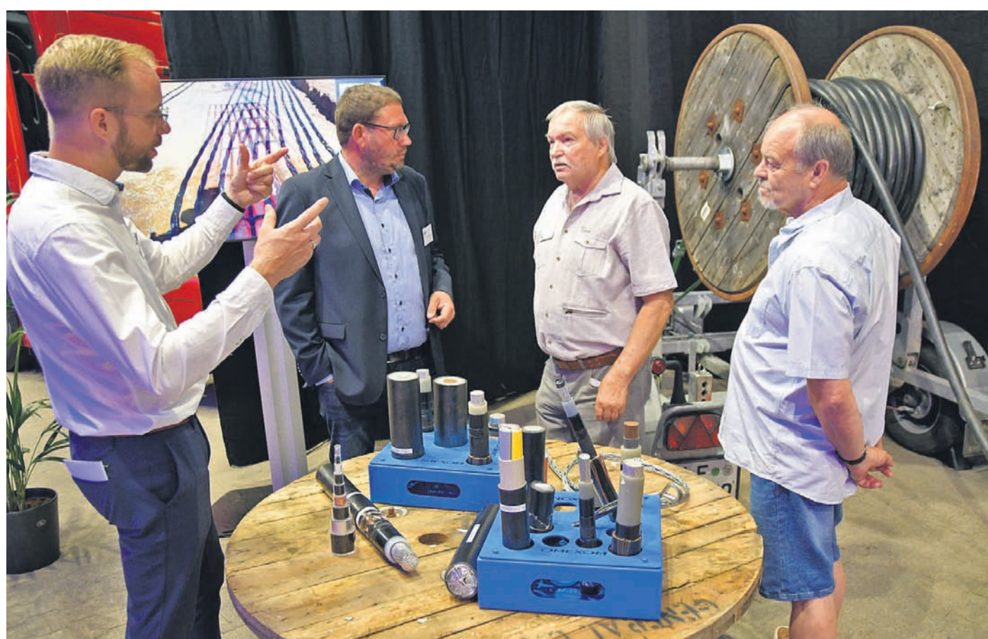
Zum Tag der offenen Tür anlässlich seines 90-jährigen Bestehens hatte das Unternehmen Omexom Uedem (ehemals Horlemann) am vergangenen Sonntag eingeladen. Dort konnten sich die Besucher ein Bild von der Vielfalt der modernen Geschäftsfelder machen. Dabei ist eines der wichtigsten Themen, gemeinsam die Energiewende zu meistern.

in die Heizkeller, wenn die Städte auch in Zukunft versorgt und erneuert werden sollen.“ Konkret verlangt das Handwerk Ausnahmegenehmigungen zum Parken am Betriebsitz für in Bewohnerparkgebieten ansässige Unternehmen. In Gebieten mit hohem Parkdruck und in autofreien Quartieren sollen außerdem ergänzend zum Handwerkerparkausweis spezielle Stellflächen für den Wirtschaftsverkehr eingerichtet werden, die nicht nur zum Be- und Entladen für Logistikzwecke, sondern auch über längeren Zeitraum hinweg in Kundennähe genutzt werden dürfen. Schließlich mahnt das Handwerk die Errichtung von smarten Parkleitsystemen an, die mit Hilfe von Sensoren freie Parkplätze im öffentlichen Raum erfassen und über digitale Kanäle anzeigen.