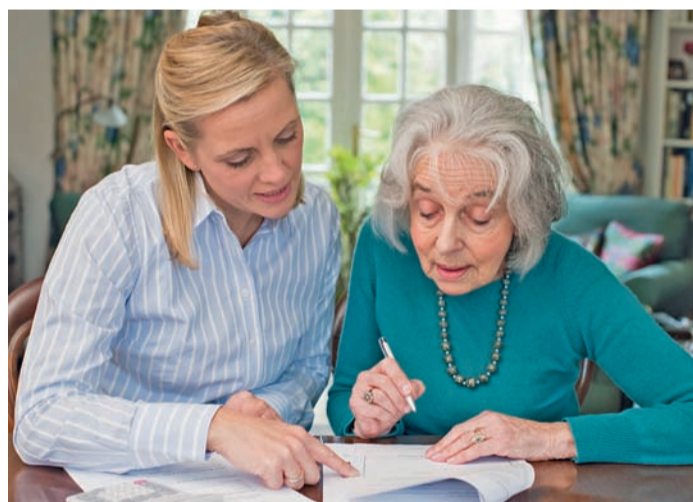
Die Begutachtung erfolgt im häuslichen Umfeld des Pflegebedürftigen.

Ist der Antrag gestellt, vereinbart der Medizinische Dienst (MD) einen Termin zur Pflegebegutachtung. Diese erfolgt im häuslichen Umfeld der Pflegebedürftigen und überprüft deren Selbstständigkeit in sechs Lebensbereichen. Der Gutachter