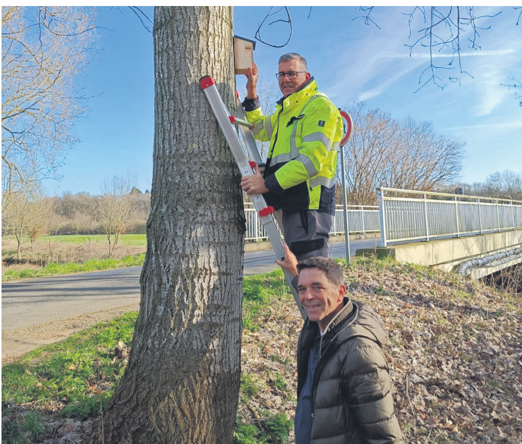
Der Golfclub Schloss Haag aus Geldern gehört zu den ersten Organisationen, die das Förderprogramm 2023 bereits abgeschlossen haben. Auf dem Golfplatz wurden Nisthilfen für Vögel angebracht.