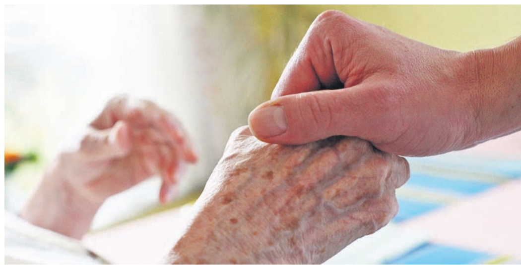
Pflegebedürftige bei der Körperpflege zu unterstützen, erfordert Wissen und Feingefühl.