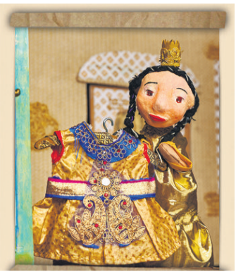
„Die Goldprinzessin“ kommt nach Emmerich.