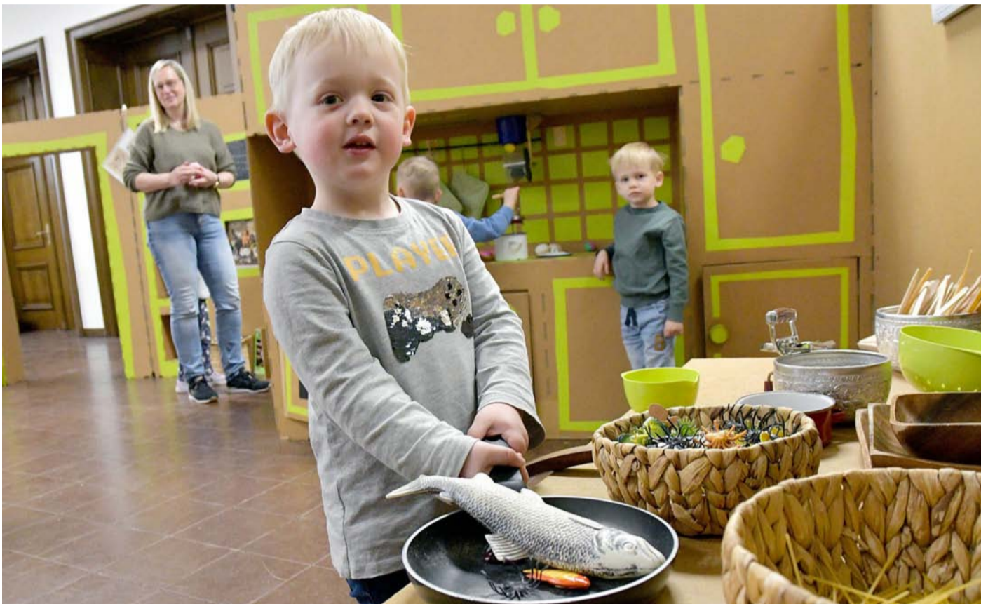
Die interaktive Wanderausstellung „Was macht die Kuh im Kühlschrank“ von Wamiki ist noch bis Dienstag, 2. Mai, im Gemeindesaal der Christuskirche in Emmerich zu Gast. Das Besondere ist, dass Kinder im Alter von drei bis acht Jahren nicht nur gucken, sondern auch ausprobieren können. Die Ausstellung kann kostenlos besucht werden, Gruppen müssen sich anmelden. Weitere Infos unter www.emmerich.de.