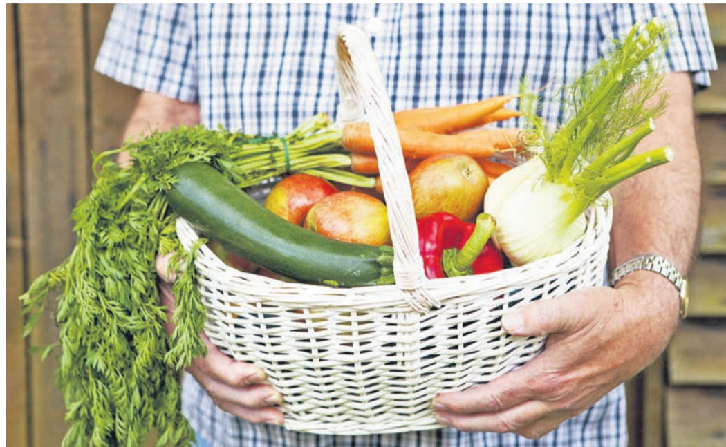
Frisches Gemuse ist naturlich immer eine gute Wahl. Aber: Es darf auch mal Tiefkuhlware sein - dann aber bitte so wenig verarbeitet wie moglich.