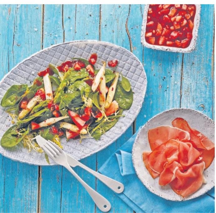
Spargel und Schinken - das passt gut.