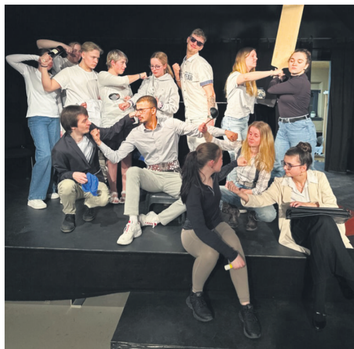
Das Ensemble „Junges Theater“ mit Jugendlichen zwischen 16 und 23 Jahren besteht seit 2015.

Karten für das „Klassentreffen“ kosten im Vorverkauf acht Euro und an der Abendkasse zwölf Euro. Anmeldung unter tik-emmerich.de und per E-Mail an buchung@ensemble-schloesschen-borghees.de