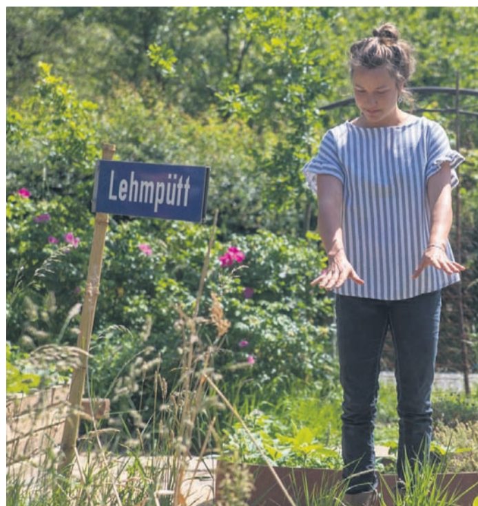
Die Natur beobachten und imitieren, auch darum geht es bei den Grundlagen der Permakultur.

Irgard Gille bietet morgen von 11 bis 17 Uhr Führungen an. Bis 18. Juni können ihre Werke sonntags von 11 bis 17 Uhr besichtigt und auch käuflich erworben werden. Der Eintritt ist frei.