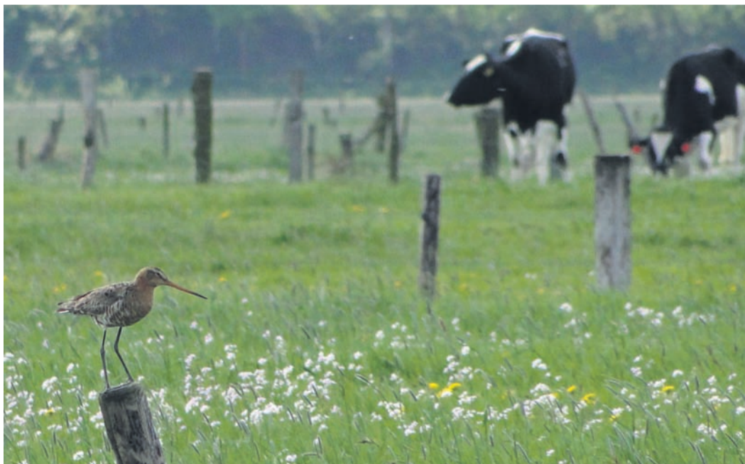
Das Naturschutzgebiet Hetter stellt einen bedeutendsten Brutplatz für Uferschnepfen dar.

Bei der zweiten Veranstaltung „Lebendiges Röhrriech – Blaukehlchen und Co.“ am morgigen Sonntag von 6 bis 8.30 Uhr bringen die Mitarbeiter des Natur-