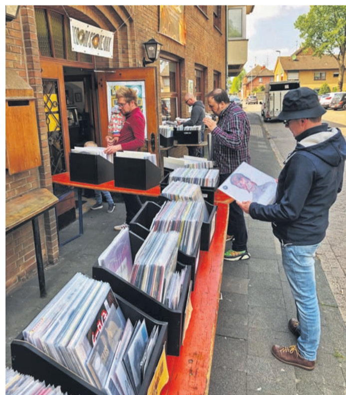
Raritäten auf Vinyl gibt es heute ab 10 Uhr in Haldern beim Pop Shop zu entdecken.